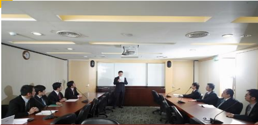
經營管理組 總經理室、管理部、稽核室、風控室

由公司整體發展角度思考未來發展與營運方向，同時掌握國內外市場趨勢與發展，因應新市場、新客戶、新業務、新法令之現況，規劃部門短中長期策略與計劃，並分析經營績效、發現問題，進而設計管理機制、執行與推動各項專案，運用數位化工具辨識市場、信用與作業風險，以協助組織達到目標。