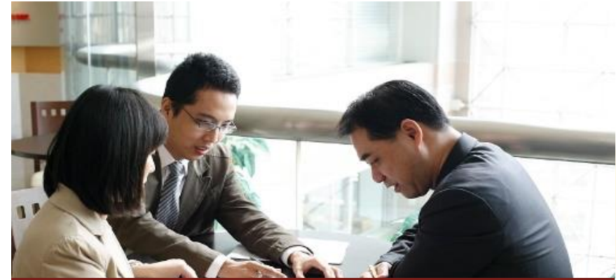
業務管理組 經紀部、企業法人部、資本市場部

在這裡可讓您學習策略分析與規劃技巧，經營與財務分析、法令遵循等，歡迎具備積極熱忱、邏輯思維能力的您加入！