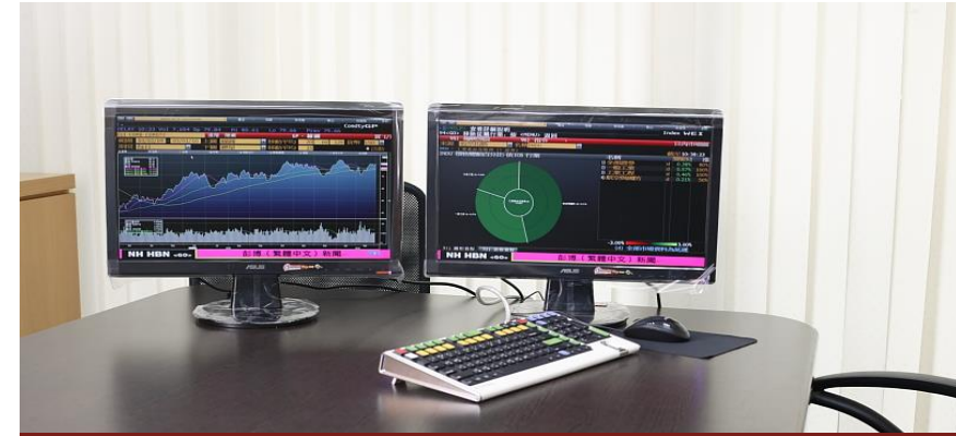
科技管理組 數位通路部、數位金融處

加入財務管理組，可讓您學習財務分析與管理決策，建置預警機制，提出營運建議等，適合具備數理邏輯能力、敏銳觀察力、服務熱忱的您加入！